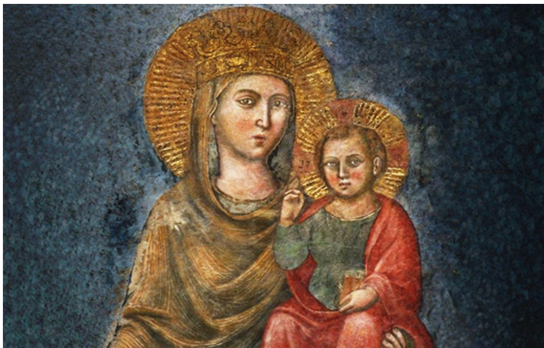
..... Nossa Senhora da Estrada