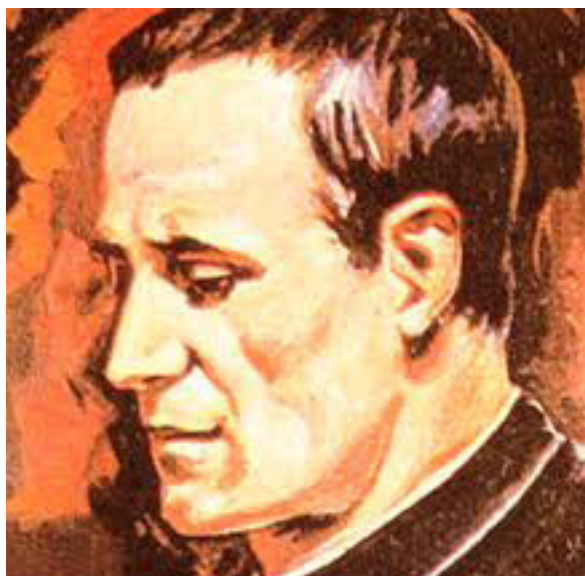
..... São José Maria Rubio