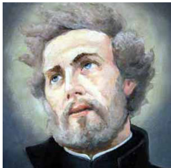
..... Santo André Bobola