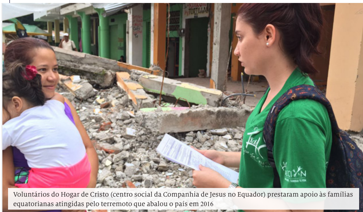
Voluntários do Hogar de Cristo (centro social da Companhia de Jesus no Equador) prestaram apoio às famílias equatorianas atingidas pelo terremoto que abalou o país em 2016