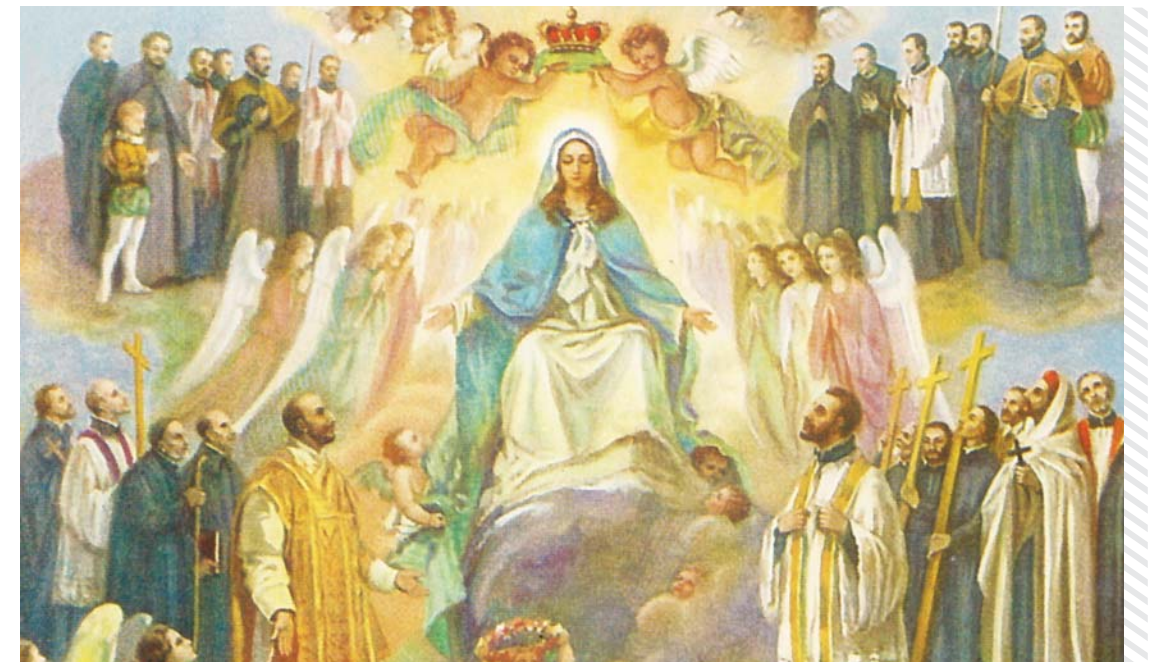
Nossa Senhora, mãe da Companhia de Jesus