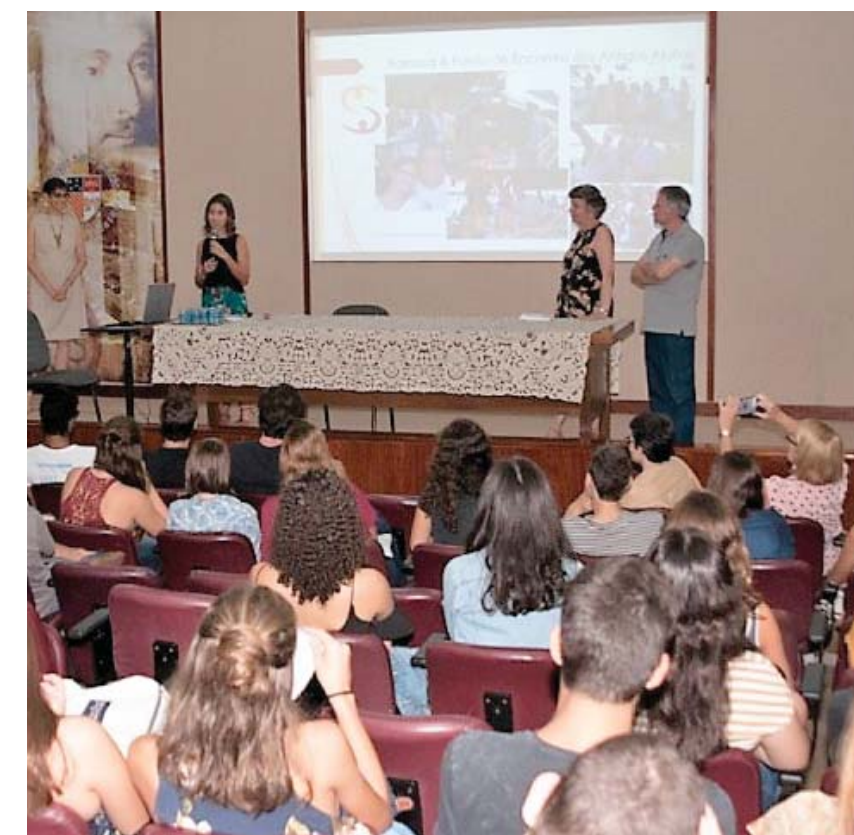
Encontro reuniu estudantes do Colégio Santo Inácio, no Rio de Janeiro