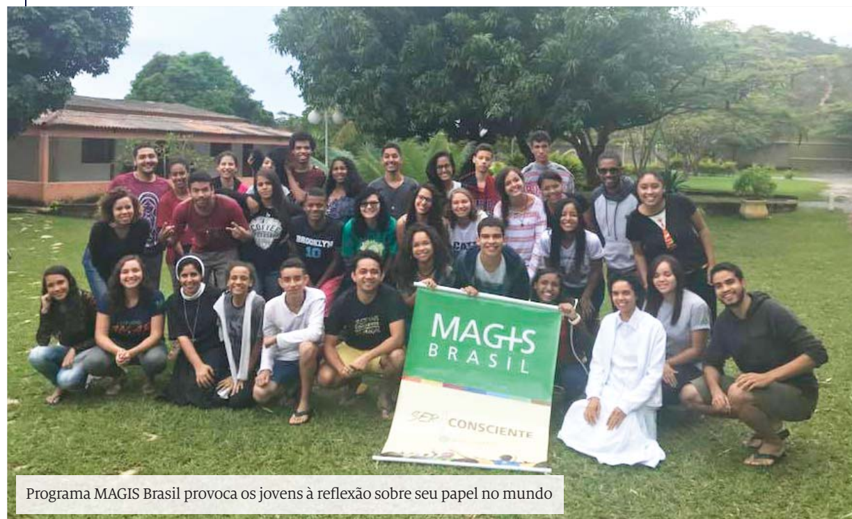
Programa MAGIS Brasil provoca os jovens à reflexão sobre seu papel no mundo

Os formandos de 2017 do Colégio Santo Inácio (CSI), do Rio de Janeiro (RJ), voltaram à instituição jesuíta para assistir a palestras sobre voluntariado. Realizado no dia 17 de março, o encontro teve como objetivo oferecer sugestões para que os jovens continuem participando de ações voluntárias, como as que são estimuladas pela pedagogia inaciana.